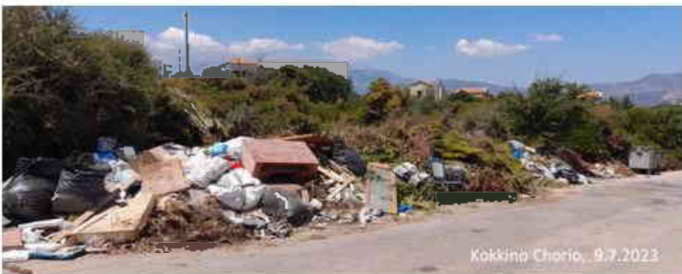
Kokkino Chorio, 9.7.2023