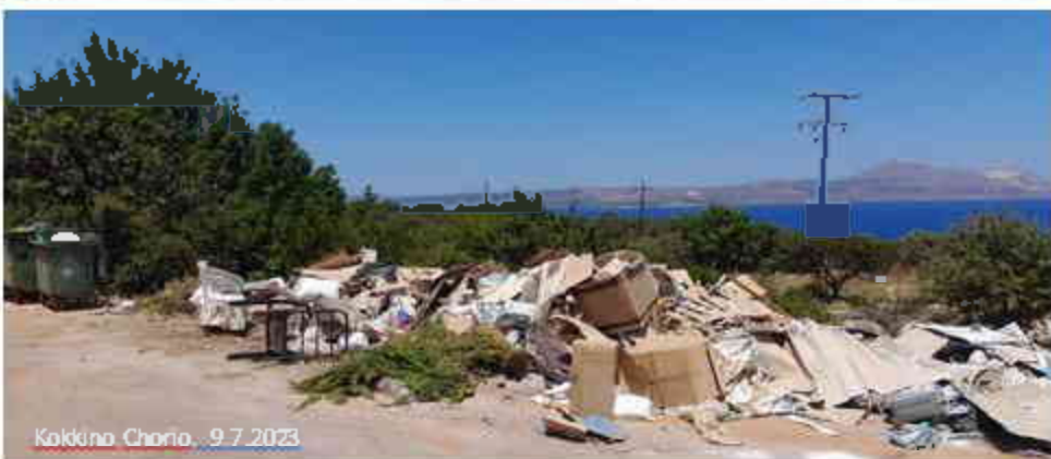
Kokkino Chorio, 9.7.2023